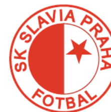
S.K. Slavia Praha 1°Classificata 2011